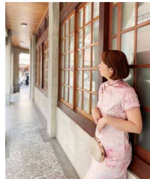
大稻埕遊客中心可以免費預約旗袍體驗活動，記得一個月前先上網預約唷！

大稻埕是一個充滿台灣歷史氛圍的地方，也許大家很常來這邊逛年貨、買布甚至是拜月老，但卻不知道這邊有全台唯一免費租借旗袍服務，尺寸齊全，光在大稻埕旅客中心就可以拍很多美美的照片，推薦給喜歡拍照嘗鮮的朋友。