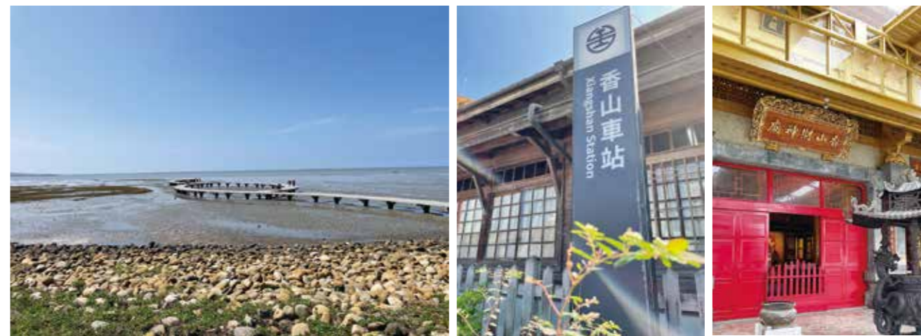
新竹香山濕地心型步道適合拍照打卡、賞蟹、觀夕陽。

香山區是新竹市中面積最大的行政區，但人口卻是相對少的地方，也許不是一個熱門觀光景點，但卻很有香山的特色。一開始選擇香山是被「香山濕地」給吸引，慢慢發現除了濕地之外，附近還有天后宮跟財神廟，還有當地有名的肉圓美食，香山車站本身也非常漂亮且具有特色，結合自然生態與人文歷史，非常適合一日遊，推薦給喜歡戶外旅遊的朋友來香山走走，感受香山的風情。