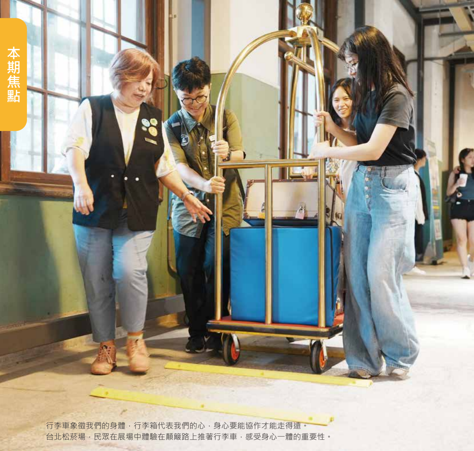
行李車象徵我們的身體，行李箱代表我們的心，身心要能協作才能走得遠。 台北松菸場，民眾在展場中體驗在顛簸路上推著行李車，感受身心一體的重要性。