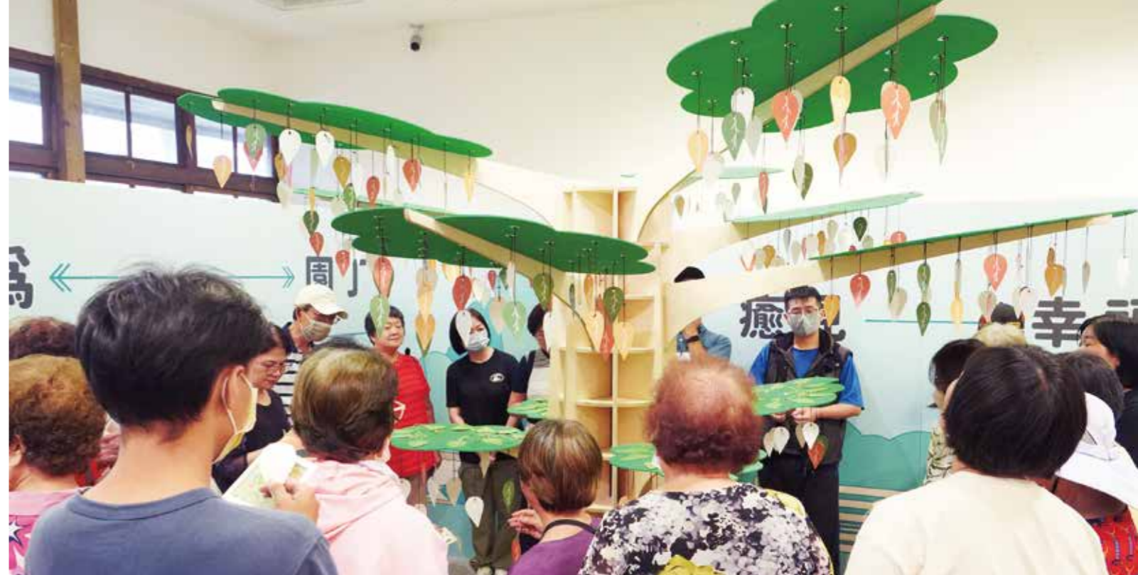
展覽最後來到生命之樹，引導參與者給自己一個擁抱，好好愛自己、照顧自己，播下希望的自癒力種子，透過自身的意願與行動，期待能創造一個健康又幸福的自己。