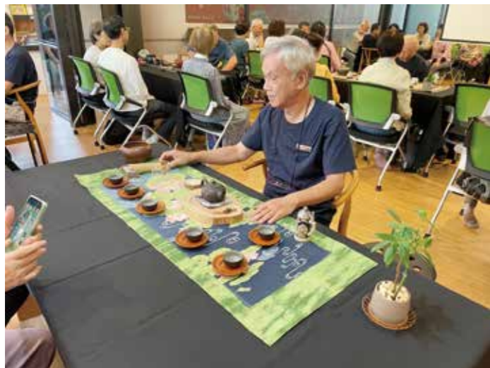
▲揚生 60 館邀請到「霸氣回甘好青春」行動服務團，於「留齡講座」中分享茶道與手作體驗。 ▶揚生 60 館邀請資生堂帶領館內長者化妝療法，上了年紀還是可以讓自己優雅美麗。