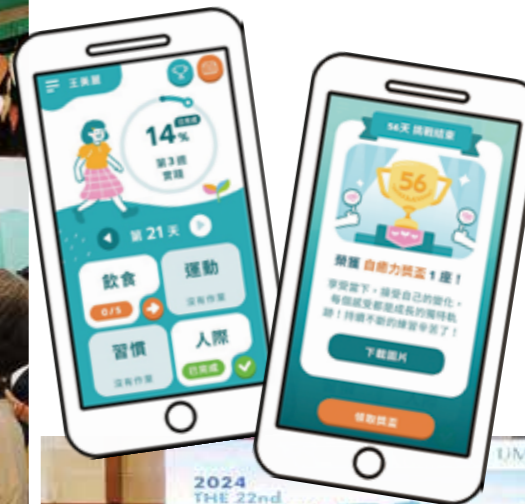
▼參與於沙巴舉行的第 22 屆國際生活品質研究學會 (ISQOLS)，入選研究論文發表。