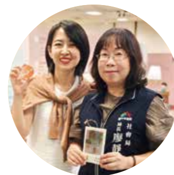
臺中市政府社會局 廖靜芝 局長