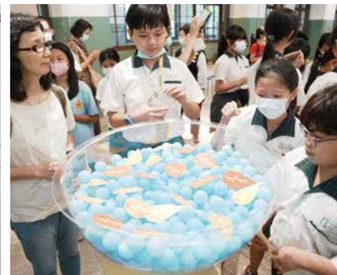
引導學生認識及接受自己的各種情緒，並藉由許願池，斷捨離那些困住自己的情緒。