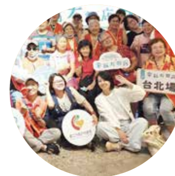
臺北市政府社會局 姚淑文 局長