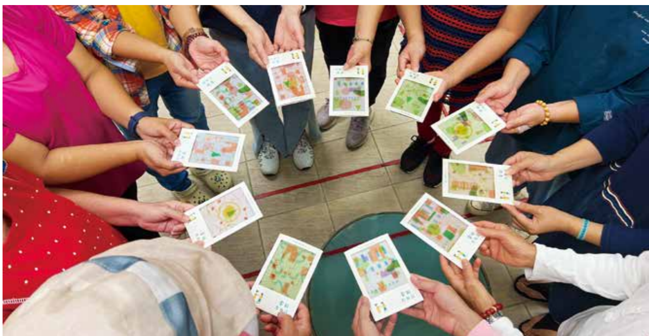
每個人今日的樣子，其實和生活中許多面向緊緊相關，透過藝術圖卡，拼成我們內心的風景，每個人都是獨一無二。