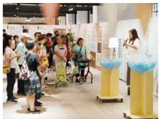
▼▶【幸福大飯店】全台巡迴體驗展，用沉浸互動體驗的展覽形式，帶領民眾探索自己的身與心，癒見幸福的自己。