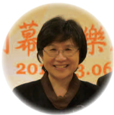
馮燕教授 ( 行政院政務委員 )

留齡小劇場與留齡合唱團在揚生六〇館【師大館】開幕茶會上首度登台表演，對於表演者與觀賞者都是一種新的體驗，我們來聽聽佳賓與揚生志工怎麼說。